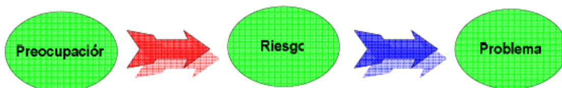
Figura 1 Preocupaciones, Riesgos y Problemas

Suele ser común el confundir preocupaciones, riesgos y problemas: mientras que una preocupación es cualquier situación sobre la cual existen dudas en algún determinado contexto y que, por lo tanto, será evaluada como un posible riesgo, un problema es un riesgo que, efectivamente, se ha producido (véase Figura 1 - Preocupaciones, Riesgos y Problemas).